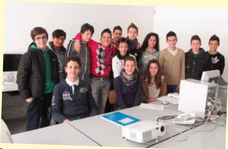
I B Geometri (Cat) 2012-13