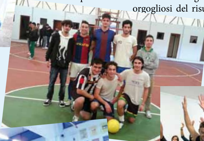
Calcetto che passione