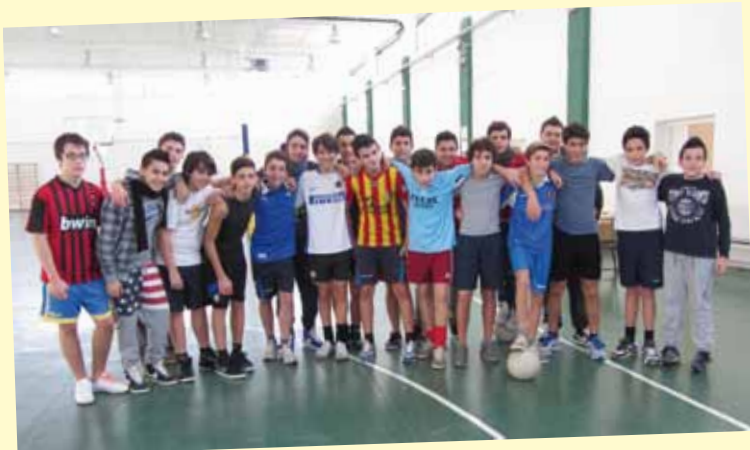
I A Geometri (Cat) 2012-13