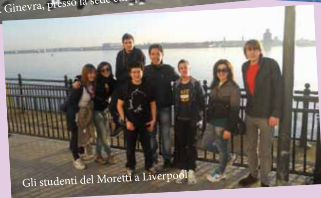
Gli studenti del Moretti a Liverpool