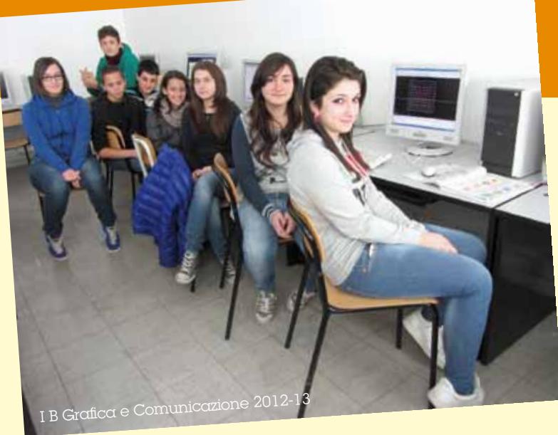
I B Grafica e Comunicazione 2012-13