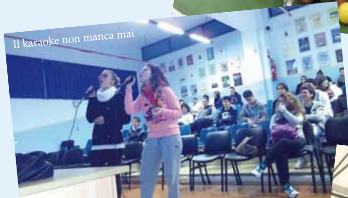
Il karaoke non manca mai