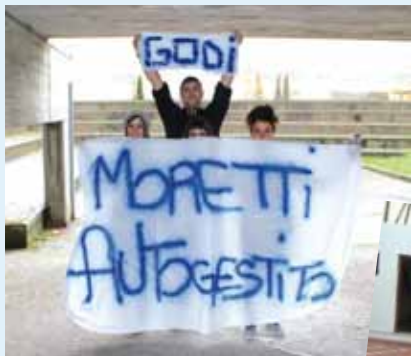
C'è chi gode così...