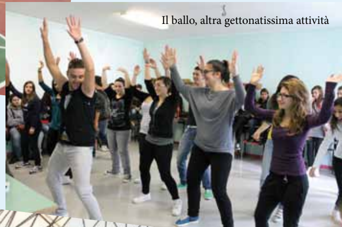
Il ballo, altra gettonatissima attività