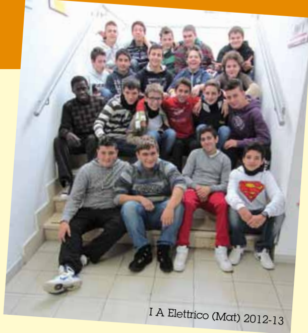
I A Elettrico (Mat) 2012-13