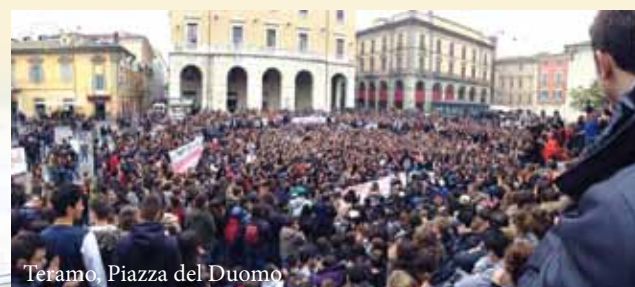
Teramo, Piazza del Duomo