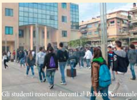
Gli studenti rosetani davanti al Palazzo Comunale