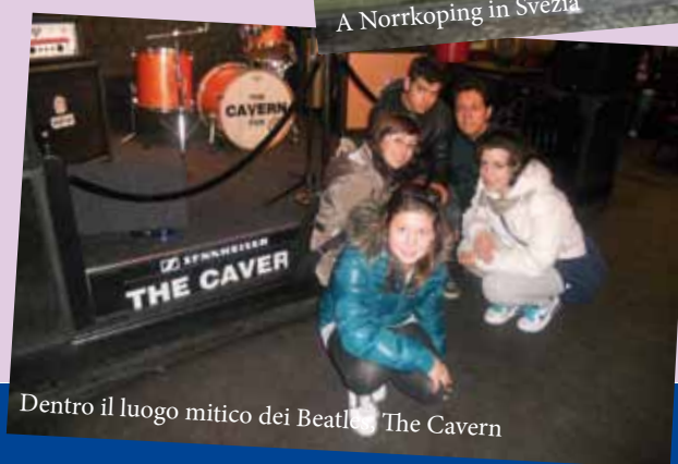
Dentro il luogo mitico dei Beatles "The Cavern"