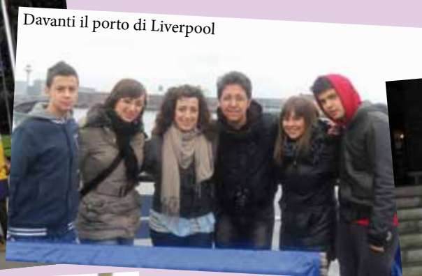
Davanti il porto di Liverpool