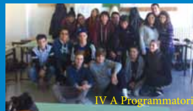
IV A Programmatori