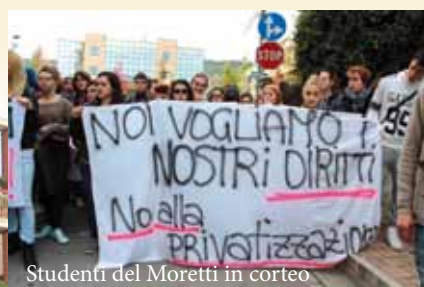
Studenti del Moretti in corteo