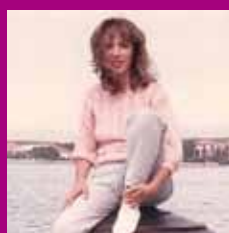
Siamo in Jugoslavia. La ventenne prof. è in vacanza