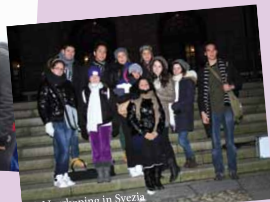
A Norrköping in Svezia