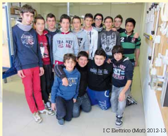
I C Elettrico (Mat) 2012-13