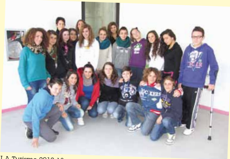
I A Turismo 2012-13