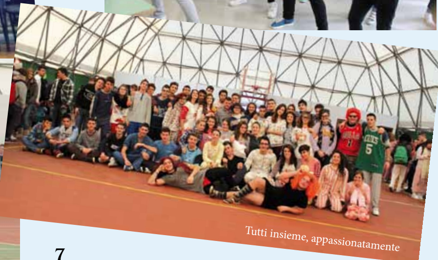
Tutti insieme, appassionatamente