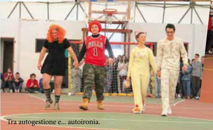
Tra autogestione e... autoironia.