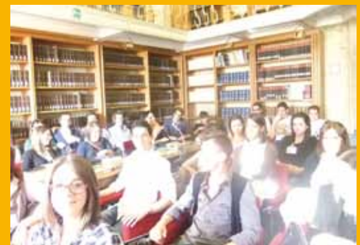
Studenti del Moretti nella Biblioteca parlamentare