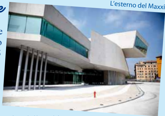
L'esterno del Maxxi