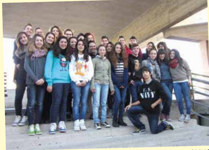
I B Turismo 2012-13