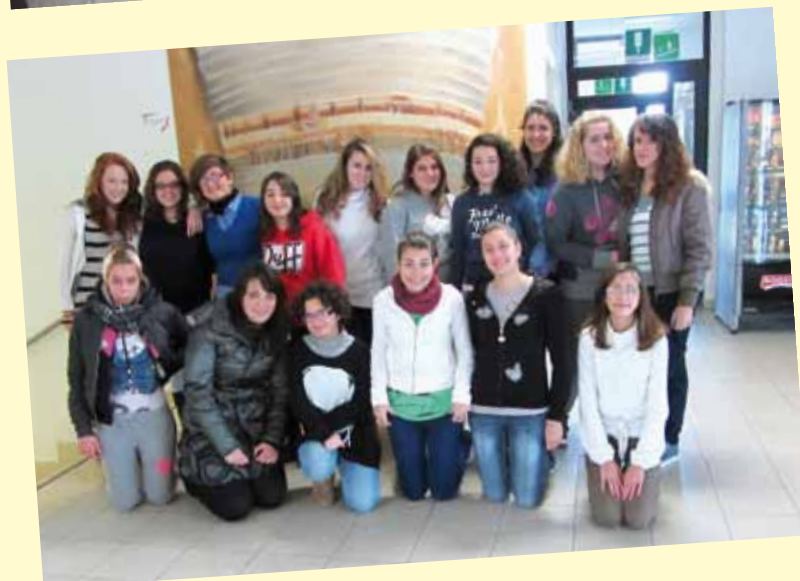
I B Moda (Pic) 2012-13